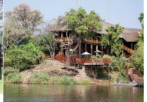
Mit Aussicht auf Elefanten- und Büffelherden: Chobe Marina Lodge in Kasane.