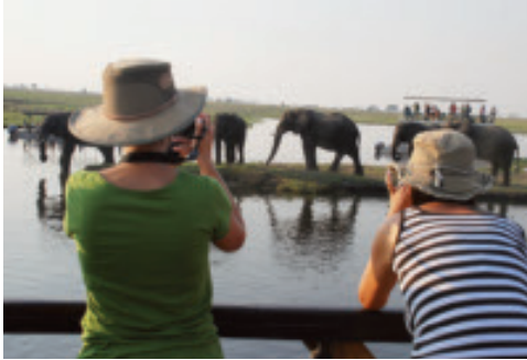
Souvenirfoto von einer Bootsfahrt auf dem Chobefluss.