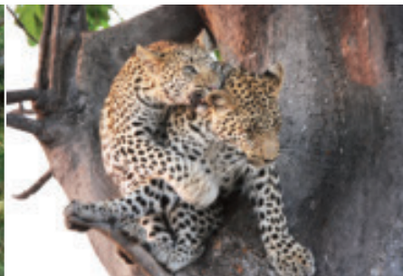
Bei Tagesanbruch beim Tubu Tree Camp gesichtet: Junge Leoparden.