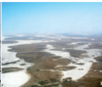
Die faszinierende Landschaft der Makgadikgadi-Pfannen.