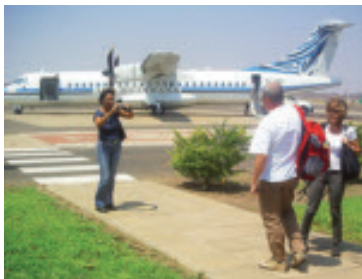
Nach dem einzigen Flug mit einer Maschine der Air Botswana ging die Reise in Kasane richtig los.