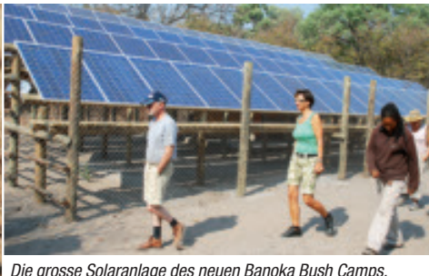
Die grosse Solaranlage des neuen Banoka Bush Camps.