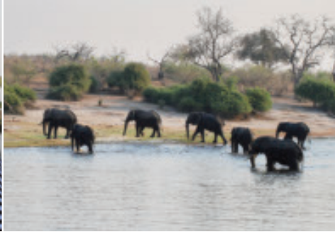
Elefanten überqueren den Chobe.