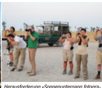
Herausforderung «Sonnenuntergang fotografieren».