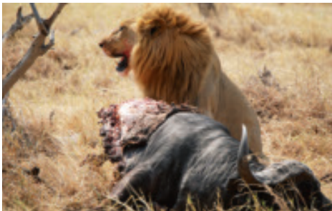
Der König der Tiere und das von seiner Familie erlegte Opfer.