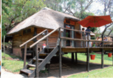
Ein Chalet in der unter Schweizer Leitung stehenden Kubu Lodge, Kasane.