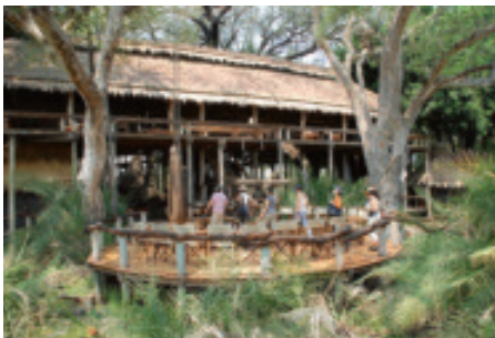
Das schönste und luxuriöseste der besuchten Camps: Jao Camp in den Makgadikgadi-Pfannen.