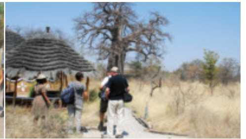
Einzigartige Umgebung: Einer von sieben Baobabs im Camp Planet Baobab.