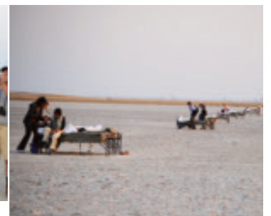
Eine gelungene Überraschung: Schlafen unter den Sternen.