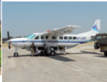
Bequemes Inland-Transportmittel: 14-plätziges Cessna 208B der Sefofane Air Charters.